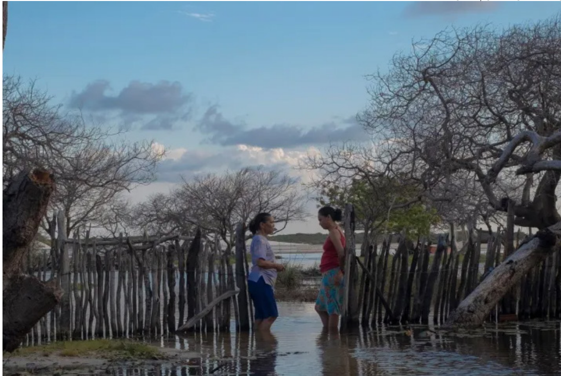
Longa assinado pelo diretor Marcelo Botta estreia no festival: estreia no Brasil em outubro