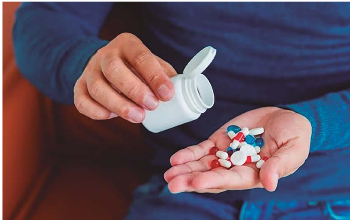
Prática da medicação sem orientação profissional pode agravar o quadro viral e até mesmo levar à morte