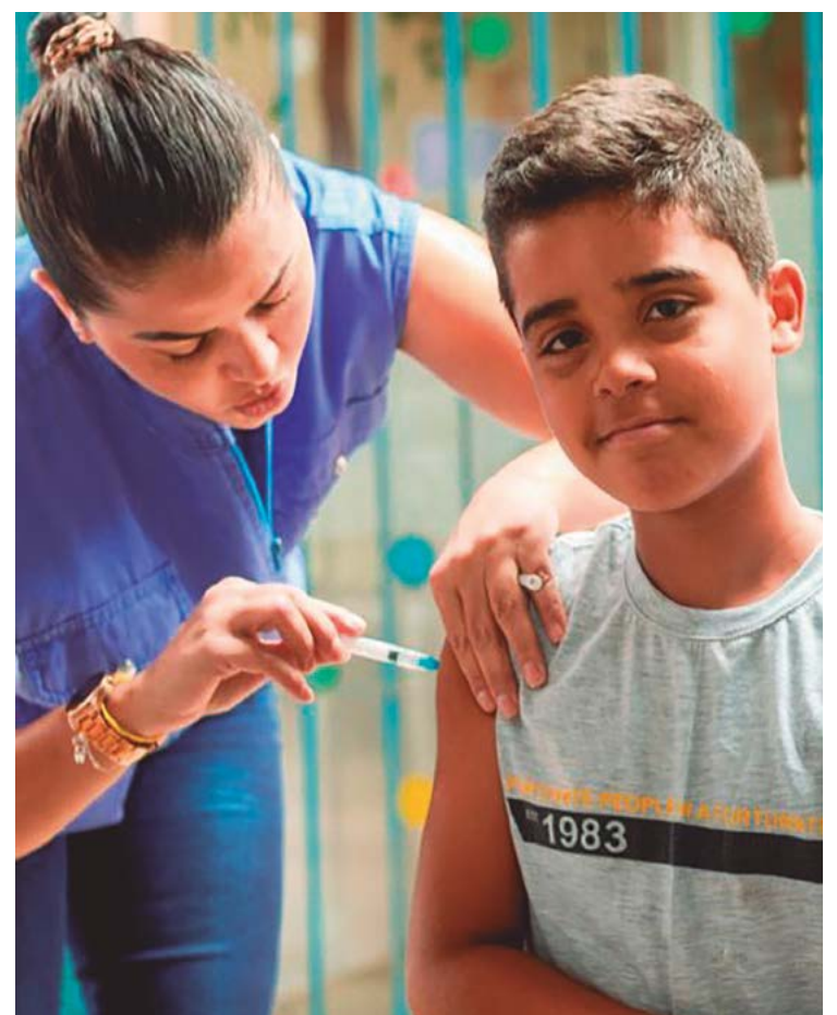
Grupo que recebe as doses do imunizante nesse momento é de 10 e 11 anos de idade; a faixa etária vai avançar progressivamente com o tempo

A relação completa dos postos, dias e horários de vacinação você confere na reportagem que está no site dmanapolis.com.br