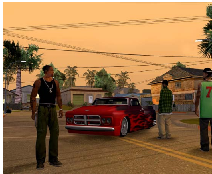
Grove Street Families: lugar clássico

A noção de que a saga vivida por CJ possa ter inspirado crimes terríveis soa frágil. Pouca gente saiu por aí ensandecido por ter visto Walter White metralhando nazistas no último