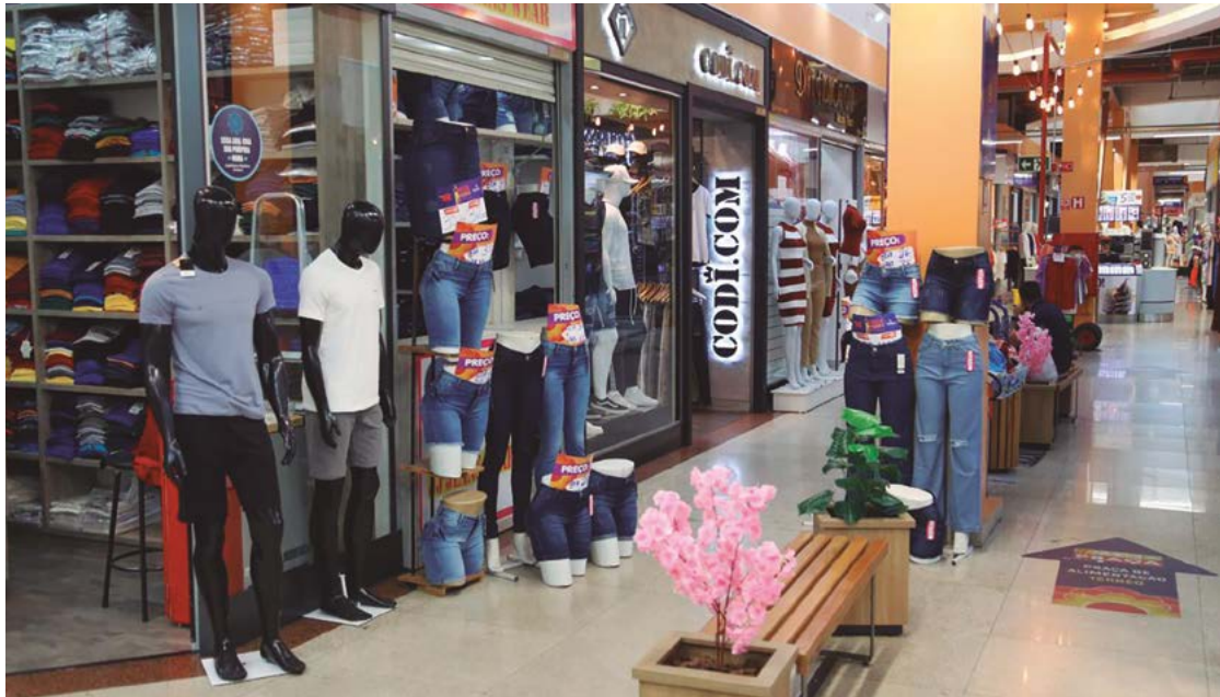
Secretaria de Indústria e Comércio informa que os destaques são agronegócio e setores secundário e terciário

“A economia goiana dá cada vez mais sinais de robustez, graças à gestão do governador Ronaldo Caiado. Junto com o agronegócio, que sempre foi uma de nossas referências, temos crescido também nos setores secundário e terciário”, comemora o titular da Secretaria de Estado de Indústria, Comércio e