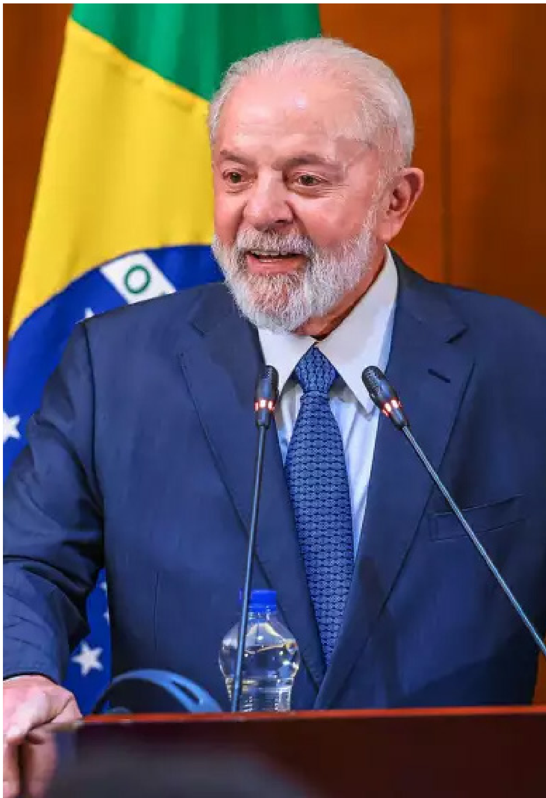
Luiz da Silva: críticas a Israel por mortes na Faixa de Gaza provoca crise diplomática

O embaixador foi colocado no que integrantes do governo consideraram uma espécie de “armadilha”. Ele não fala nem compreende hebraico, e ficou exposto diante das câmeras, sem poder esboçar reação, enquanto ao seu lado o chanceler israelense, Israel Katz, declara-