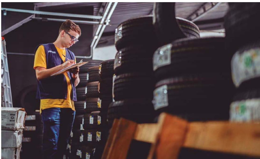
Pesquisadores do órgão encontraram o pneu 205/60R15 com valores que variam entre R$ 339,29 e R$ 883,00

“Utilizamos como metodologia a coleta de preços pelos técnicos do órgão, in loco, sempre acompanhados de um responsável pelo estabelecimento, atestando por meio de assinatura a veracidade das informações prestadas. Vale lembrar que os preços refletem a realidade praticada no momento da coleta, podendo sofrer variações para mais ou para menos, já que tais produ-