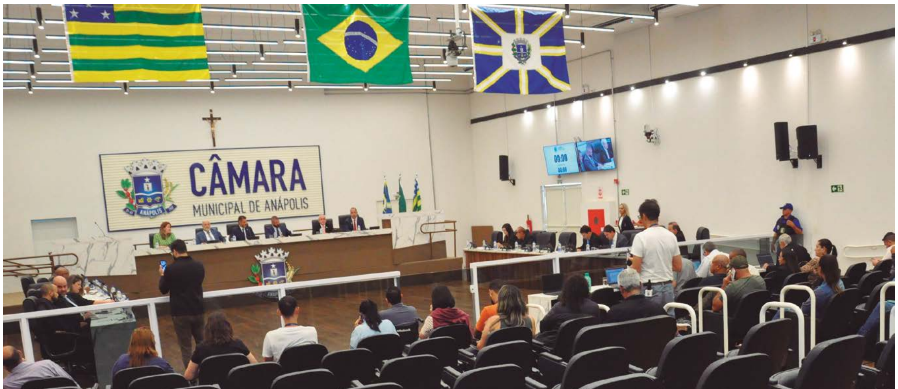
Legisladores anapolinos aguardam a janela, prevista pela Justiça Eleitoral, que nesse ano vai de 7 de março a 5 de abril para transferências partidárias com vistas às eleições de outubro

Janela partidária é o período de 30 dias em que ocupantes de cargos eletivos, obtidos em pleitos proporcionais, podem trocar de partido sem perder o mandato. A possibilidade está prevista no artigo 22-A da Lei dos Partidos Políticos (Lei 9.096/95) e é considerada justa causa para desfiliação partidária, se for feita nesse período permitido. Nesse ano o período é de 7 de março a 5 de abril. (Com reportagem de Lucivan Machado)