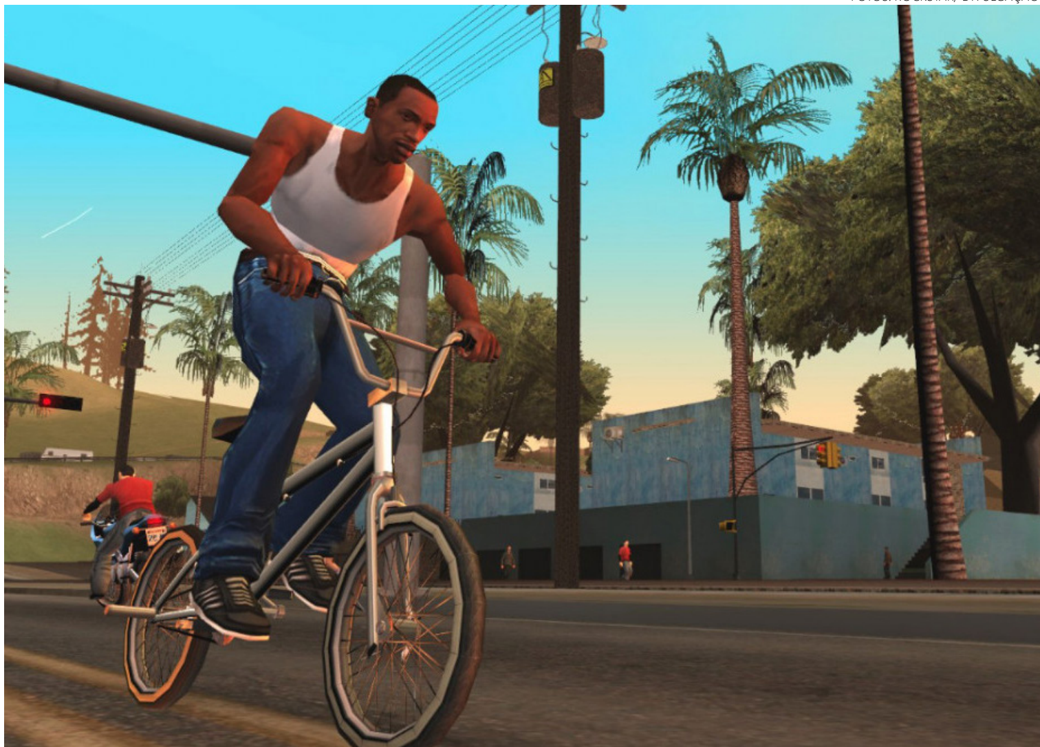
Carl Johnson, o CJ, protagonista de San Andreas: personagem vive no submundo do hip-hop, nos anos 1990