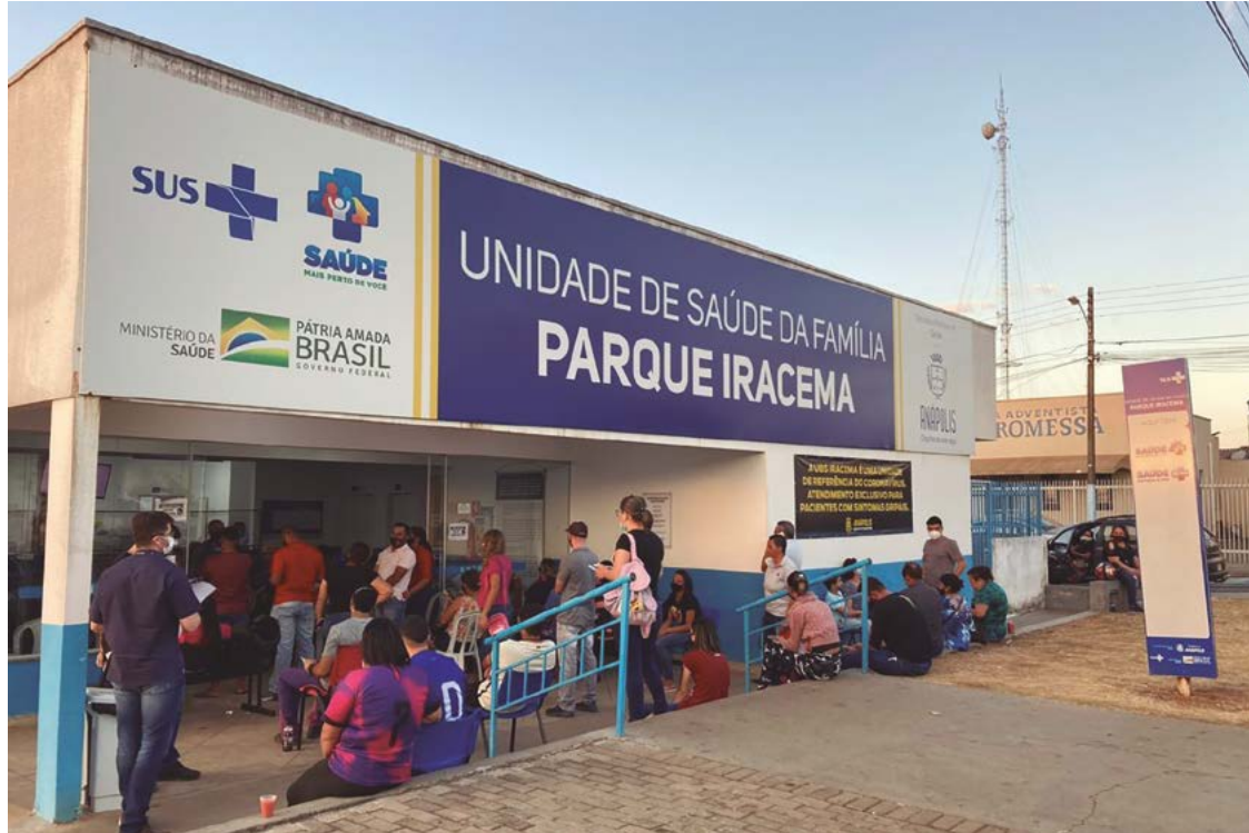
Intenção da gestão municipal é estender qualidade de atendimento da UPA Pediátrica a todas as UBSs da cidade

“Nós sabíamos do problema. Faltava médico porque nós não podíamos contratar. Hoje nós temos médicos em todas as Unidades Básicas de Saúde. Nenhuma vai ficar sem equipe. Esse é um compromisso que a Funev fez comigo e já está cumprindo. Isso tudo é muito importante. Volta a dar capacidade de atendimento para a Prefeitura e destrava o ZAP da Saúde”, comemora o prefeito. “Agora nossa capacidade de atendimento dobra. A população pode voltar a solicitar sua consulta pelo ZAP. As agendas foram abertas”, completa.