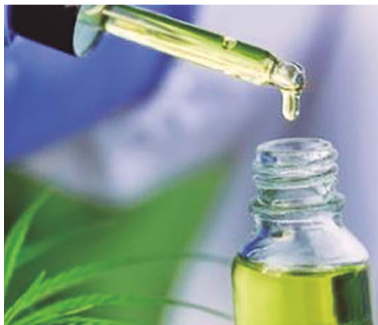
Cannabis medicinal tem indicação no tratamento de Parkinson e Alzheimer

Associação terapêutica que atua em Anápolis conta com mais de quatro mil associados e faz defesa da utilização do medicamento