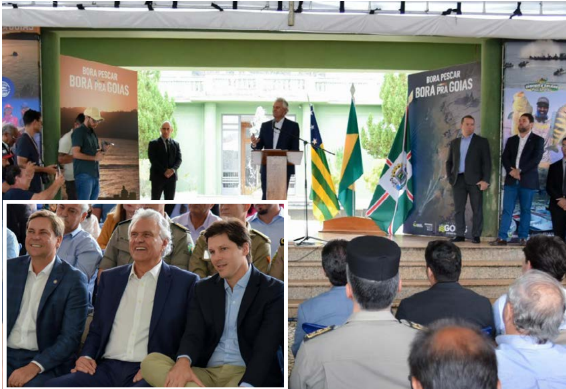
Solenidade anuncia eventos de pesca: turismo de pesca esportiva recebeu investimento de R$ 1,2 milhão

Por sua vez, o Gigantes do Araguaia ocorrerá em Aruanã, Nova Crixás e São Miguel do